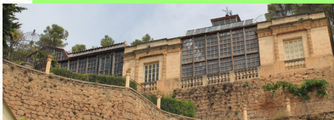
Invernadero a la izquierda y pajarera a la derecha, de la Finca Brutinel

En las instalaciones del molino papelerero destacan sus magníficos jardines, invernadero y pajarera acristalados de estilo modernista y que podemos ver desde nuestro camino.