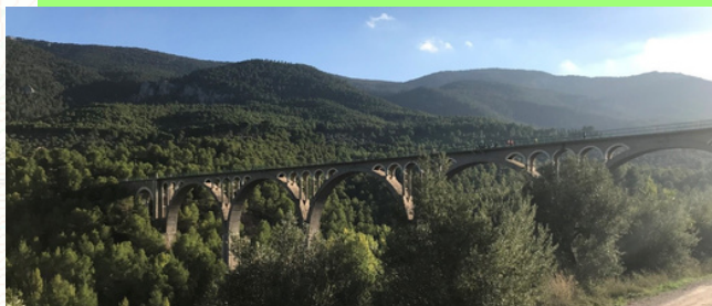
Vista del Puente de las Siete Lunas (tiene 8)

Desde este punto tomamos dirección izquierda hacia Alcoy, para encontrarnos enseguida con el espectacular Pont de les Set Llnes sobre el río Polop, con 46 metros en su máxima altura, y una longitud de 230 metros..