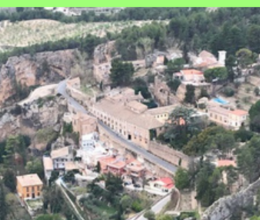
Conjunto de la zona del Salt

En ese mismo lado de la ruta veremos enseguida una fuente, junto a la que sale una senda por la que empezaremos a subir a la zona de 'les Casetes del Salt'. A pocos metros tenemos un yacimiento arqueológico neandertal y un complejo fabril papelerero del siglo XVIII.