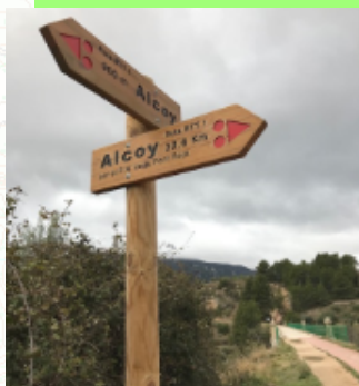
Señalización ruta Cicloturista BTT

Aquí lo que hacemos es coger una pequeña senda que de la carretera sale por su izquierda, justo antes de llegar arriba del todo, y que nos llevará a cruzar el río Barxell.